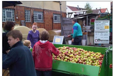
Apfelsaftaktion der Konfirmanden

Vernissage am 3. Oktober ein großer Erfolg.