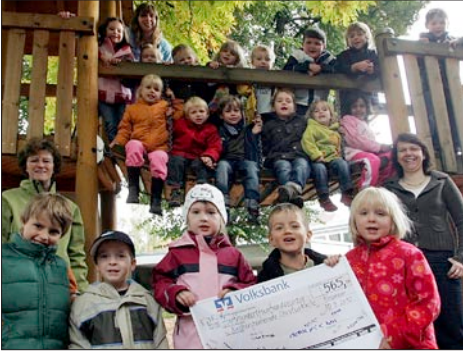
565 € vom Kindergarten, Foto: Jörg Bächle, Kirchheimer Teckbote

Nach der langen Sommerpause werden sich viele Kirchenmitglieder fragen, wie sich das