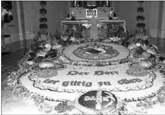
Erntedankaltar der kath. Kirche in Inningen

Erntedank hat eine uralte Tradition. Früher, als die Menschen noch überwiegend auf und vom Land lebten, war man viel unmittelbarer von der eingebrachten Ernte abhängig. Unser tägliches Brot gib uns heute! Alle gute Gabe kommt