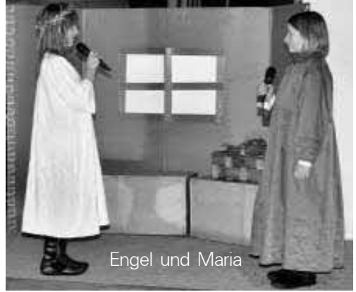
Engel und Maria